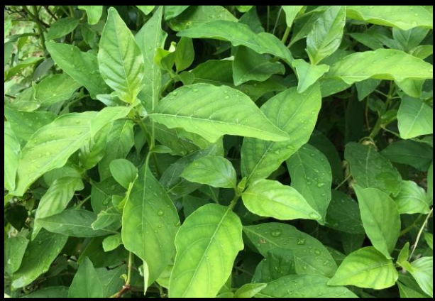
ทองพันชั่ง