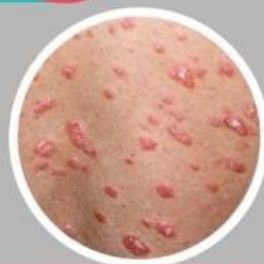
ชนิดตุ่มเล็ก