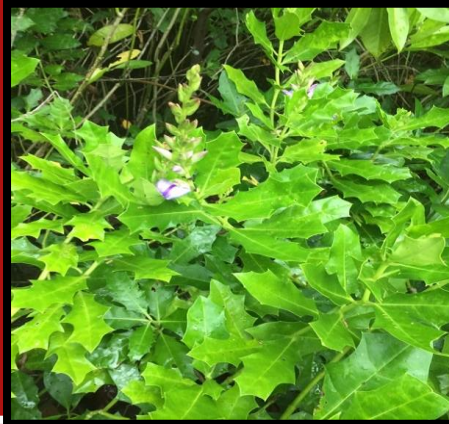
เหงือกปลาหมอ