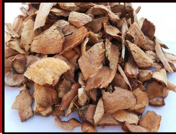
ข่าเย็นไต้