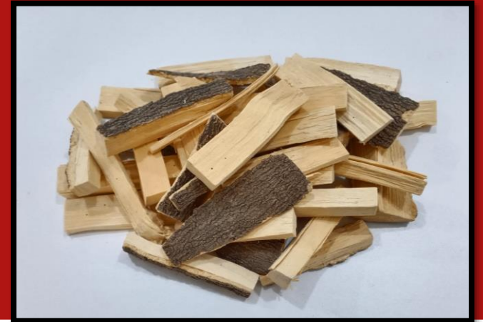
ชันทองพยาบาท