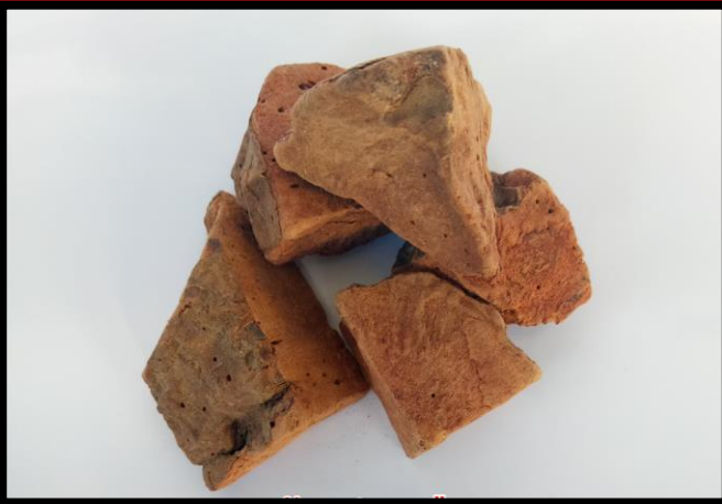
ข่าเย็นเหนื่อ