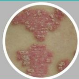
ชนิดผื่นหนา