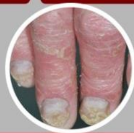
ชนิดเกิดที่เล็บ