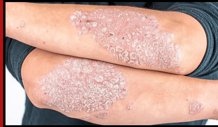
ลักษณะรอยโรคของ วาตะเด่น

รอยโรคมีลักษณะแดง ผู้ป่วยรู้สึกร้อนบริเวณรอยโรค หรือมีอาการใช้ร่วมด้วย