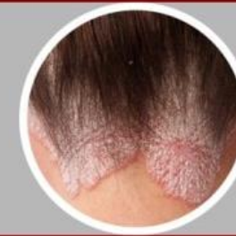
ชนิดเกิดที่หนังศีรษะ