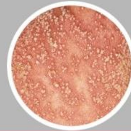
ชนิดตุ่มหนอง