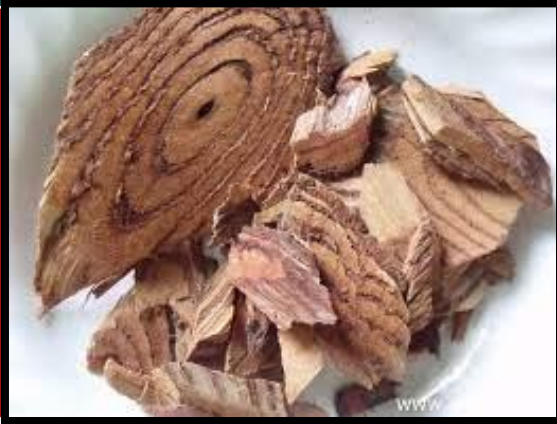
กำแพงเจ็ดชั้น

▶ กลุ่มสมุนไพร สรรพคุณ บำรุงโลหิต ฟอกโลหิต แก้โลหิตเป็นพิษ