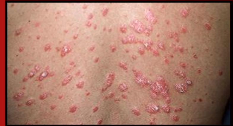
ลักษณะรอยโรคของ เสมหะเด่น

รอยโรคมีลักษณะสะเก็ดแห้งหรือขุยปริมาณมาก มีอาการคัน