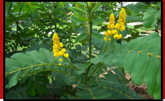
ชุมเห็ดเทศ