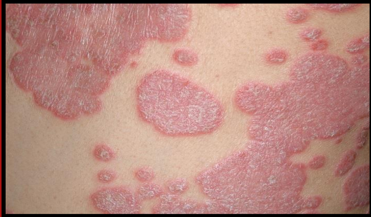
ลักษณะรอยโรคของ ปิตตะเด่น

รอยโรคมีลักษณะแดง ผู้ป่วยรู้สึกร้อนบริเวณรอยโรค หรือมีอาการใช้ร่วมด้วย