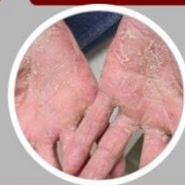
ชนิดเกิดที่มือและเท้า