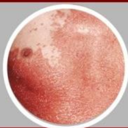
ชนิดแดงและเป็นเกล็ด