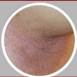
ชนิดรอยพับ